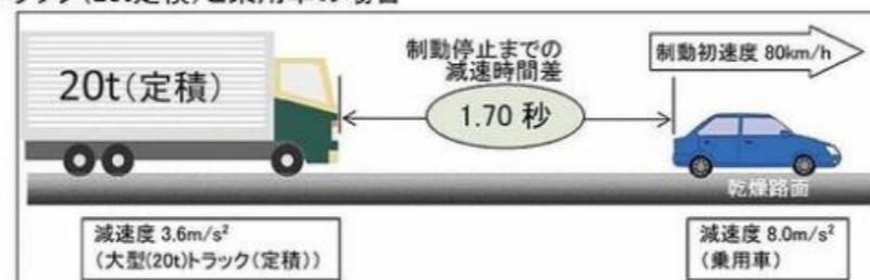
乗用車と大型車の理想的な車間距離