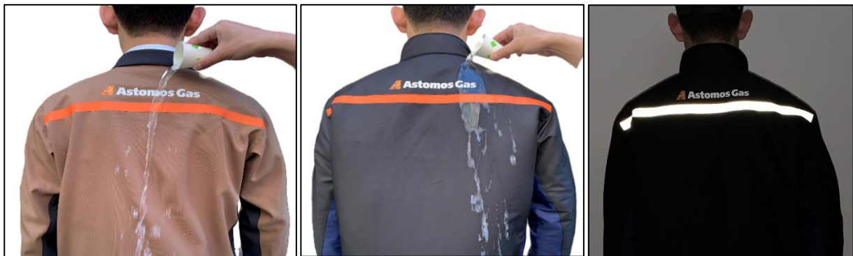
ブルゾン・防寒ブルゾンへの撥水加工