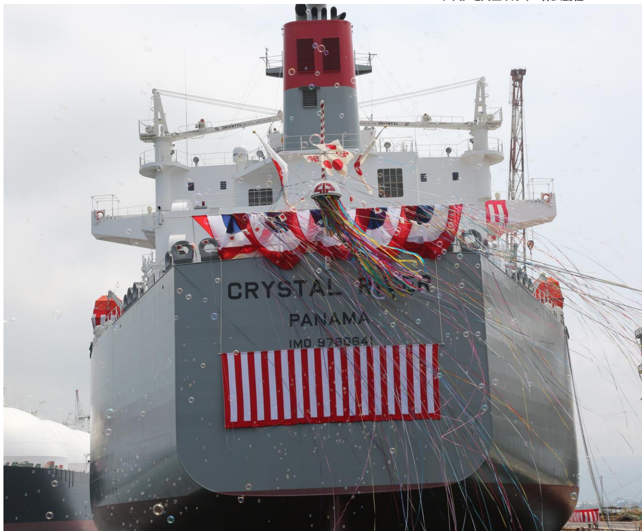
命名式中の本船 (CRYSTAL RIVER)